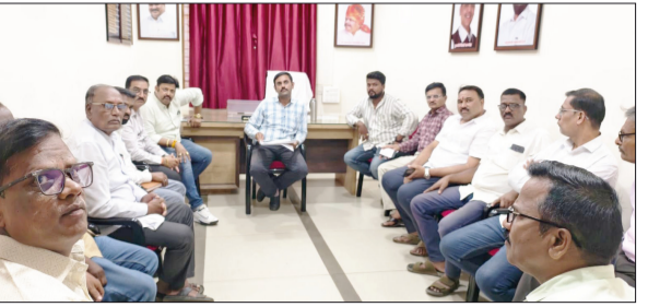
मुरगूड शहरातील रस्त्याचे ३० मे पर्यंत कॉंक्रीटकरण संपवणे आणि १५ जून अखेर गटर्स व फुटपाथसह काम संपवणे.