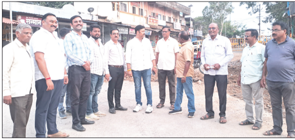
मुरगूड : रस्ता कामाची पाहणी करताना प्रकल्प अधिकारी, पालिका अधिकारी, आंदोलनकर्ते नगरसेवक व अन्य. दुसऱ्या छायाचित्रात पालिका

कागल गडहिंग्लज रस्त्यापैकी मुरगूडमध्ये कापशी रोड - हुतात्मा तुकाराम चौक ते बीएसएनएल ऑफिस हा मार्ग मुरगूड शहरांतर्गत येतो. या रस्त्याचे काम अतिशय संघ गतीने चालले असल्याचा आरोप करत मुरगूडच्या सत्ताधारी नगरसेवकांनी आंदोलन केले होते.